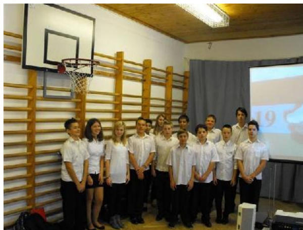
Fotó: Domonkosné Szemerédy Zsuzsa