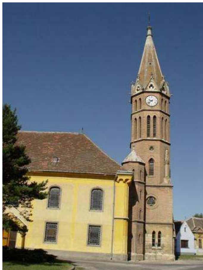
(folytatás a 2. oldalon)

„Kicsi fehér templomotokba Most minden erők tömörülnek. Kicsi fehér templom-padokba A holtak is mellétek ülnek. A nagyapáink, nagyanyáink, Szemükben biztatás vagy vád: Ne hagyjátok a templomot, A templomot s az iskolát!“