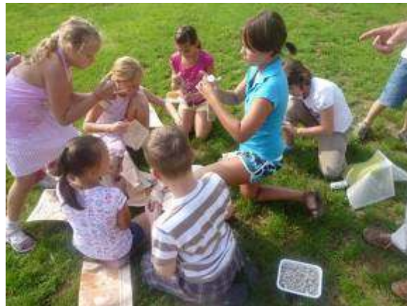
Fotó: Michael Heinrichs