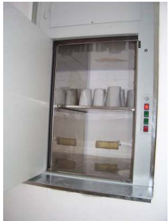
Étellift üzem közben