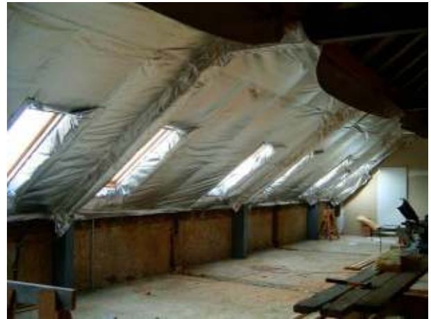
Készül a folyosó