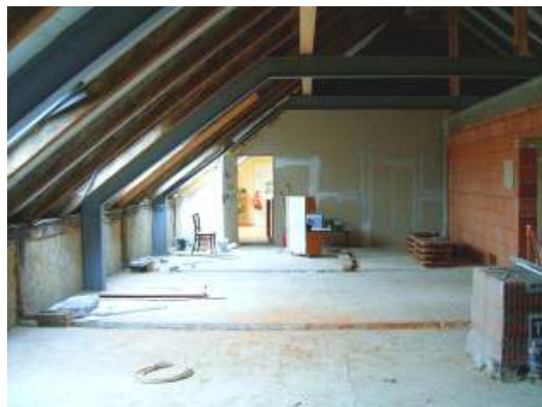
Szerkezet készen a II. ütemre