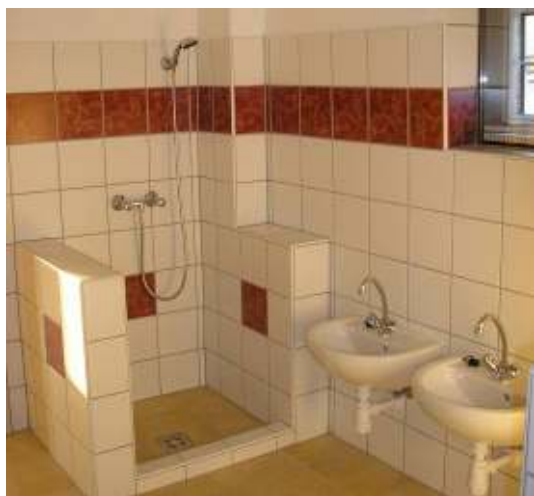
A felújított földszinti vizes blokk

A csoportok felköltözése után elérkeztünk a felújítás következő szakaszához, ahol az alsó szinten egy olyan terem kialakítására került sor, mely teljes mértékig megfelel egy esetleges óvoda-bölcsőde csoport kritériumainak. Mára már ezek a munkálatok is befejeződtek, a Micimackó csoport is visszakerült a megújult csodaszép termébe. Itt a mosdó a csoportszobából nyílik, és kibővült a volt Süni csoport kétharmadával, a maradék részéből, pedig raktár lett. A földszinten egy tornaszobát is sikerül kialakítanunk. Óvodánk mindegyik helységében korszerű tűzjelző rendszert, a folyosókra tűzcsapokat szereltünk fel.