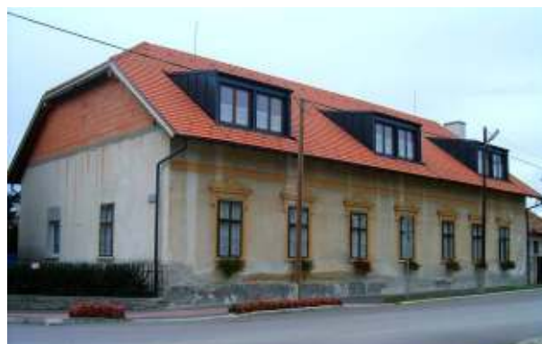
Az elkészült tetőtér