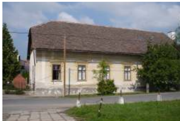
Tetőtér beépítés előtt

bővítését és felújítását, melyre 2008-ban pályázati forrásból került sor. A Nyugat-Dunántúli Regionális Fejlesztési Tanács: Önkormányzati fejlesztések támogatása HÖF/CÉDE pályázatán 10 millió forintot nyertünk, önkormányzati önrészünk 13 millió forint volt. Az átépítés első ütemében a tetőtér cseréje és csoportszobák helyének szerkezetkész kialakítása, valamint lépcsőház, mosdó és egy csoportszoba készült el, ahova a Katica csoport került.