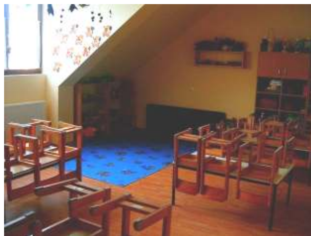
Első tetőtéri foglalkoztató (Katica csoport)