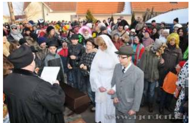
Fotó Ferstl Róbert