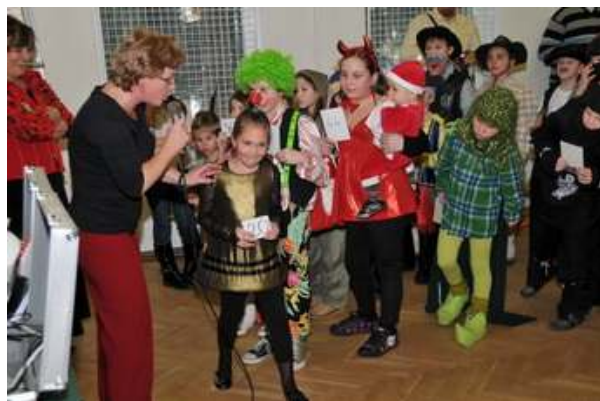
Fotó Ferstl Róbert