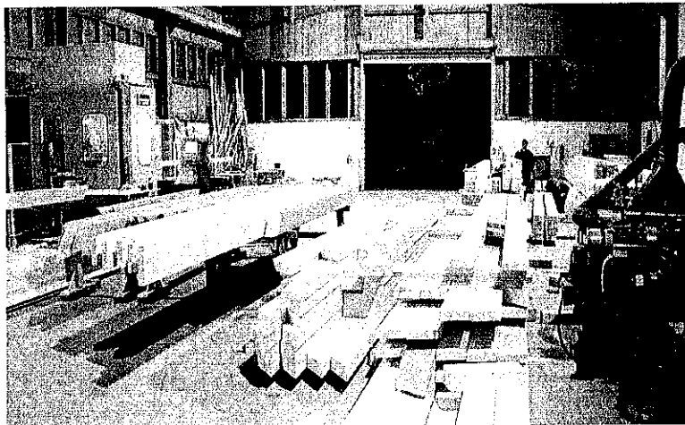
A munkafolyamatok java az üzemben történik, a helyszínen csak össze kell építeni.

Az egyre ismertebb cég – családi vállalkozásként – 1990 óta működik az erdészeti-faipari szakterületen. 2004-ben egy addig Magyarországon még nem működő technológiát állítottak üzembe, ezzel egy új faipari tevékenységet alapoztak meg. Ez a tevékenység az építészethez kapcsolódik, ezen belül is a több ezer éves múlttal bíró fával történő építkezéshez, ezért úgy fogalmazhatjuk meg: faépítészet – modern technológiával.